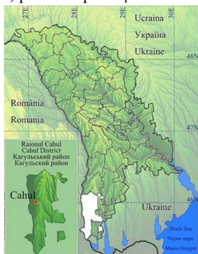
Fig. 1. Poziția geografică a orașului Cahul

Un aspect nefavorabil al așezării geografice este poziția periferică și distanța relativ mare (175 km) până la capitala țării – municipiul Chișinău.