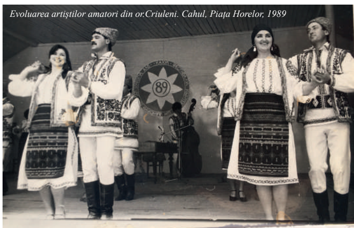
Evoluarea artiștilor amatori din or.Criuleni. Cahul, Piața Horelor, 1989