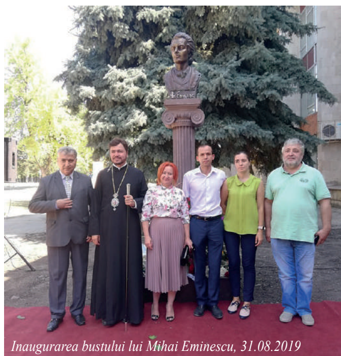
Inaugurarea bustului lui Mihai Eminescu, 31.08.2019