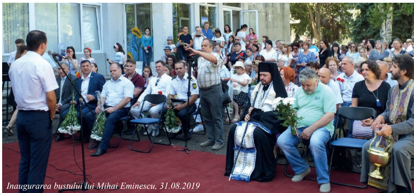
Inaugurarea bustului lui Mihai Eminescu, 31.08.2019

nevoie de un astfel de monument. Acest monument nu este doar al lui Mihai Eminescu, este al Limbii Române, a tot ceea ce înseamnă românesc. Cred că așa a vrut Dumnezeu să fie astăzi, nu mai devreme, nu mai târziu, dar sigur că ne-am propus să fie într-o zi frumoasă, dedicată Zilei Limbii Române, la 30 de ani de când vorbim despre 31 august 1989, de limba română, de alfabetul latin și la 130 de ani de la trecerea în neființă a Poetului.