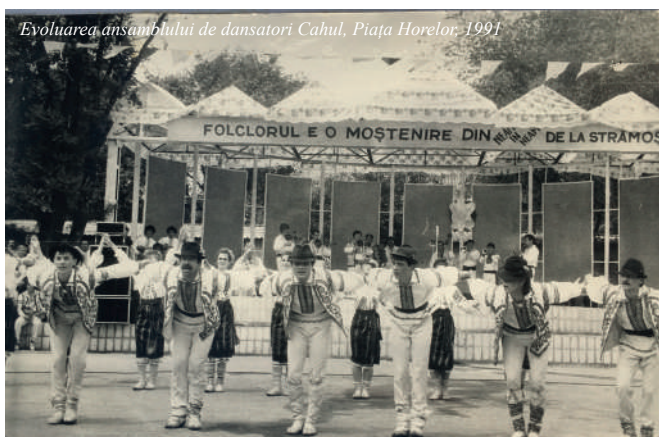
Evoluarea ansamblului de dansatori Cahul, Piața Horelor. 1991

1997 ... 16 colective au evoluat în cadrul festivalului, din cauza ploii soldate cu suspendarea concertului de gală ratându-și șansa unei prime apariții în fața publicului cahulean și cel de al 17-lea: Ansamblul de Cântece și Dansuri Populare Bulgărești „Rodoliubie” din Taraclia. Majoritatea – jos pălăria, palmaresul lor fiind cu adevărat impresionant. Cu experiența participării la festivaluri folclorice internaționale din Germania, Bulgaria, Italia, Polonia, România veni la Cahul Ansamblul „Codru” din Orhei, „Strugurașul” de la Palatul Culturii din Ungheni și-a lăsat autografele în Bulgaria, Iugoslavia, China, Grecia, Spania, Irak, Rusia, Egipt. Fondat încă