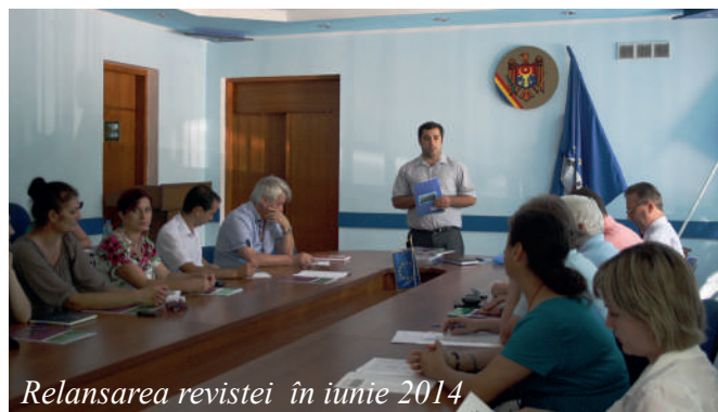
Relansarea revistei în iunie 2014