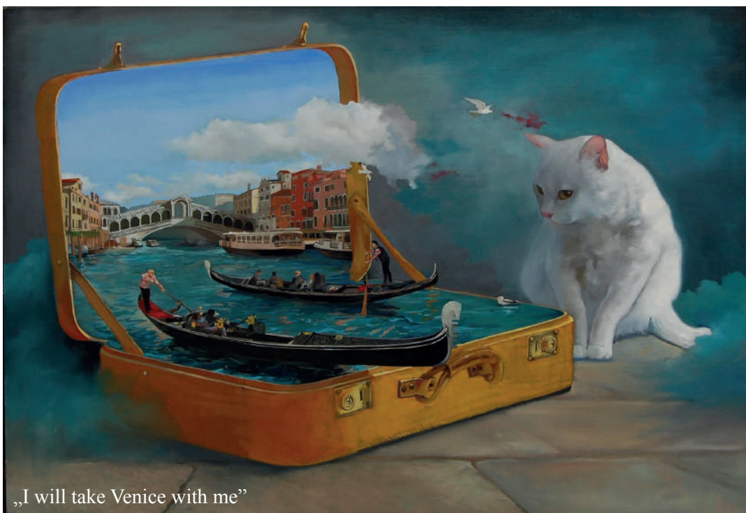
„I will take Venice with me”