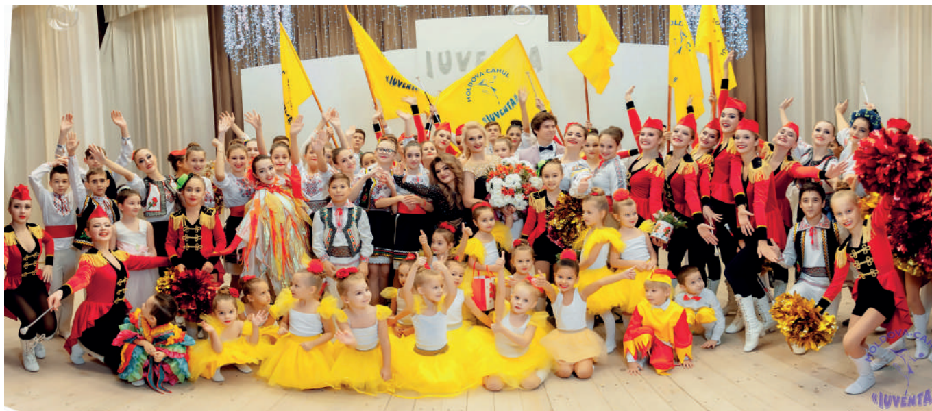
Ansamblul „Iuventa”: 25 de ani de activitate (1994-2019)