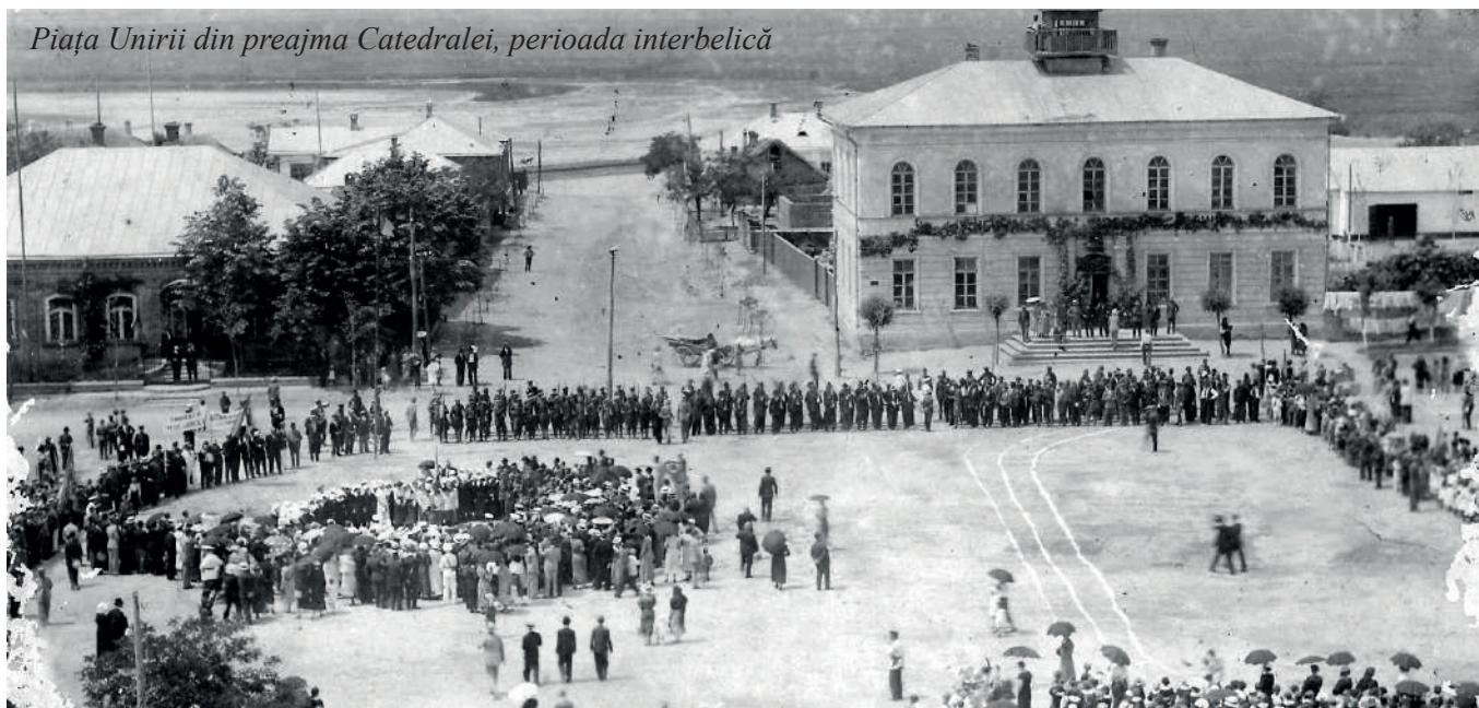
Piața Unirii din preajma Catedralei, perioada interbelică