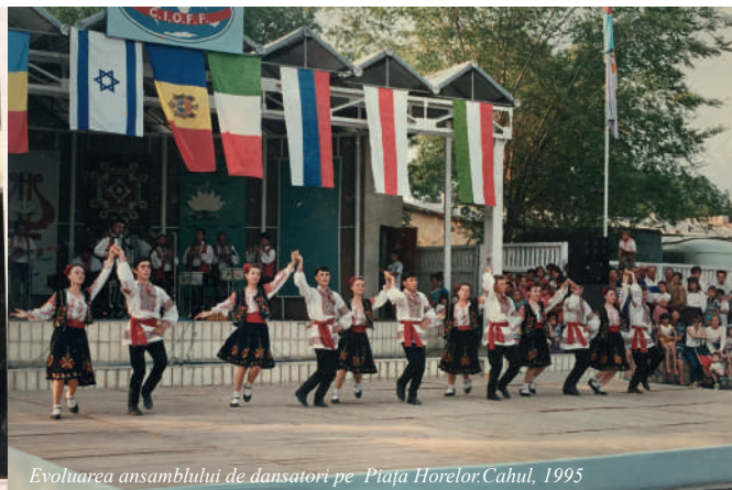
Evoluarea ansamblului de dansatori pe Piața Horelor.Cahul, 1995