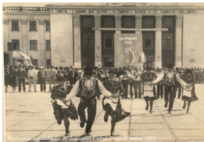
Evoluarea ansamblului de dansatori Cahul, Piața Horelor, 1989

– 17 colective s-au perindat pe scena Teatrului de Vară rezervată grupurilor folclorice și etnofolclorice. Două din ele – „Țărăncuța” din Chișinău și „Ștefan Vodă” din Strășeni – sunt colective-model. S-au remarcat și altele. În ce măsură, însă, ele și-au realizat intențiile? De-i vorba de dansul popular, reușita a fost incontestabilă: s-au adus în scenă dansuri vechi, chiar conservate, s-au reînviat dansurile tematice „Fedeleșul”, „Frunza