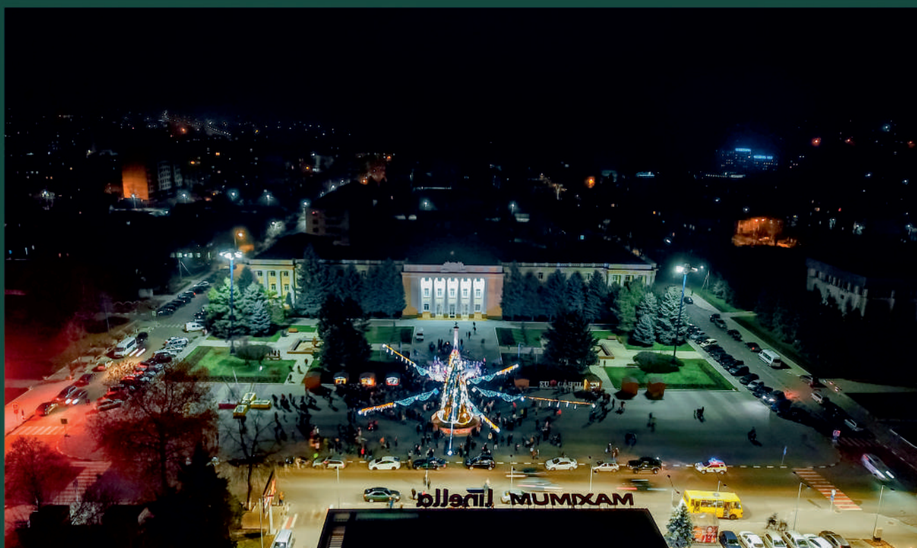
Pomul Sărbătorilor de Iarnă în Piața Independenței, mun. Cahul, 2019